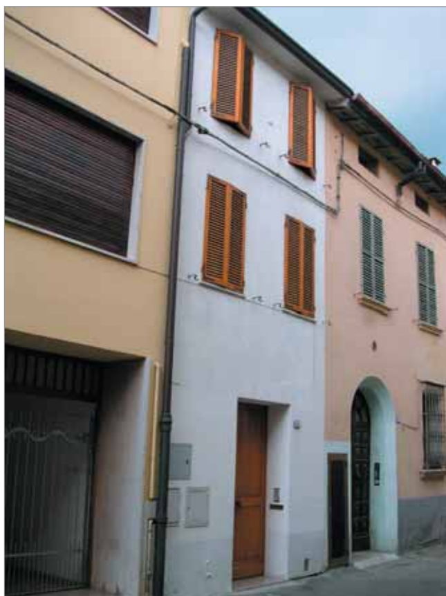
Via Oberdan 12 Fronte Principale